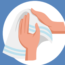
Séchez-vous les mains