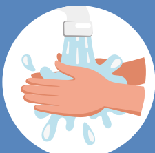
Rincez-vous les mains