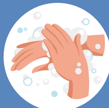
À l'arrière des mains