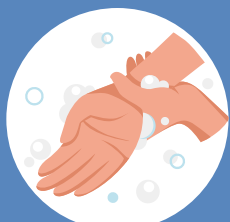
Et des poignets