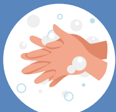
Les doigts entrelacés