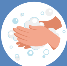
Paume contre paume