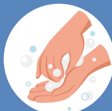
Au niveau des ongles