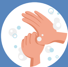
À la base des pouces