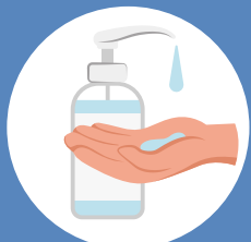
Utilisez du savon