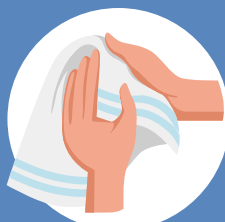
Séchez-vous les mains