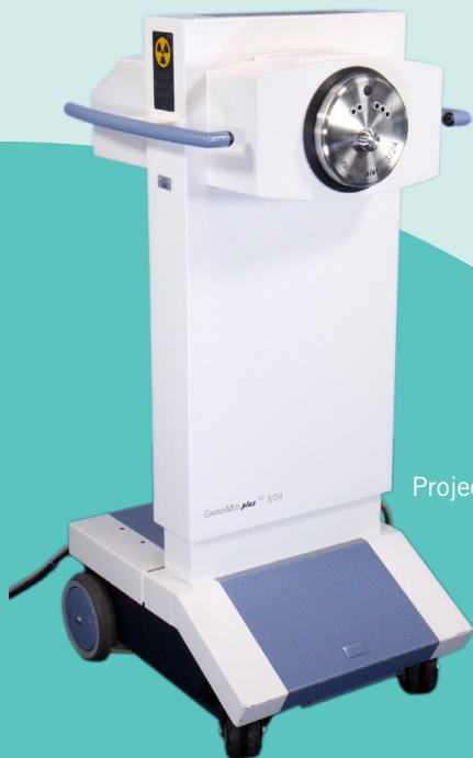
Projecteur de source