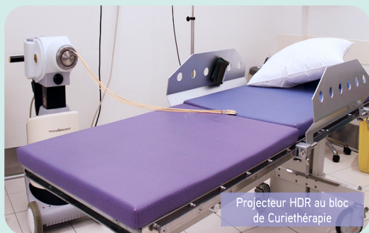
Projecteur HDR au bloc de Curiothérapie